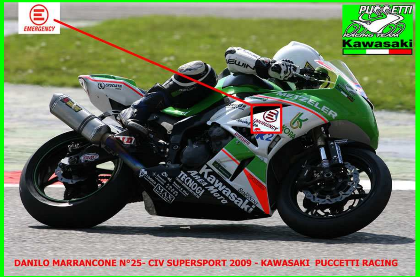
DANILO MARRANCONE N°25- CIV SUPERSPORT 2009 - KAWASAKI PUCSETTI RACING